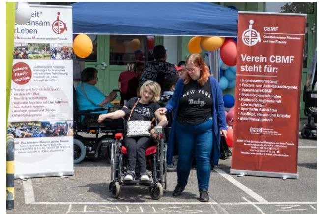
Bilder oben: Sitzungsteilnehmer:innen der „Wiener Gemeinderätlichen Kommission für Inklusion und Barrierefreiheit“ vor unserem CBMF-Stützpunkt / Start und Zieleinlauf des CBMF- Rollstuhlparcours