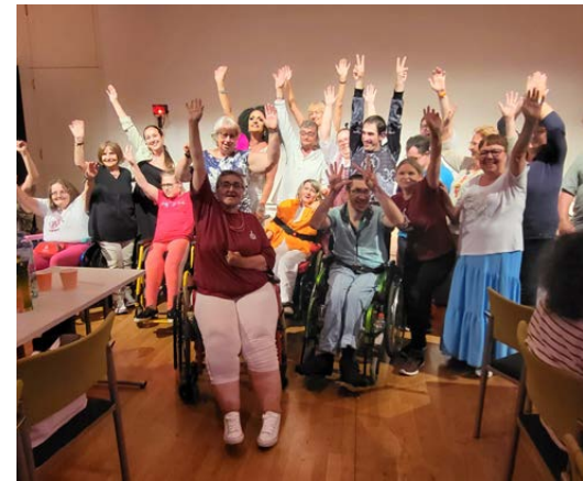
Bilder oben: Die Mitglieder und Ehrengäste genießen die Show der „Manne“queens