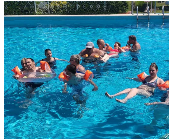
Bild links: Mit dem Rollstuhl ins Meer / Bild mittig: Mit den Rollstühlen durch Venedig Bild rechts: Spaß beim Schwimmen und Plantschen im Hotel-Pool