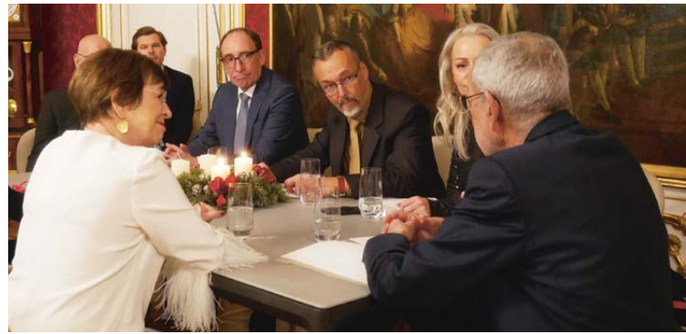
Bild oben links: CBMF-Mitglieder mit unserem Bundespräsidenten beim Weihnachts-empfang in der Wiener Hofburg